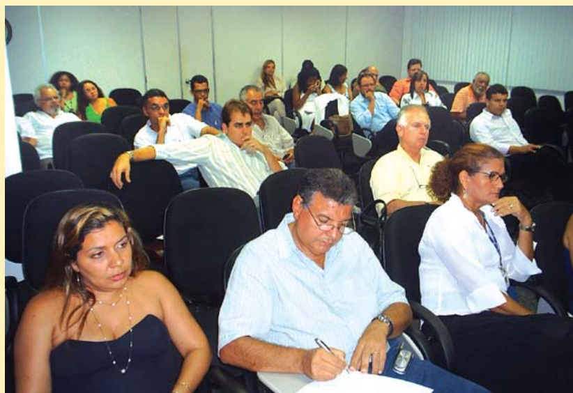
Bioquímicos defendem o exercício profissional