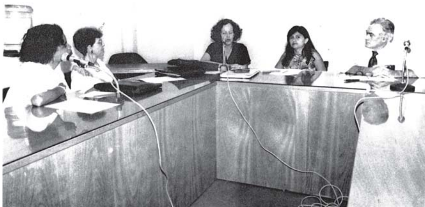
A deputada Alice Portugal promoveu um amplo debate sobre a privatização da Bahiafarma, na Assembléia Legislativa, em 1996

vés da Lei Delegada nº 10, de 4 de novembro de 1980, com o objetivo de produzir e comercializar produtos químicos e farmacêuticos a preços abaixo dos de mercado, destinados prioritariamente à população carente através da rede hospitalar do estado.