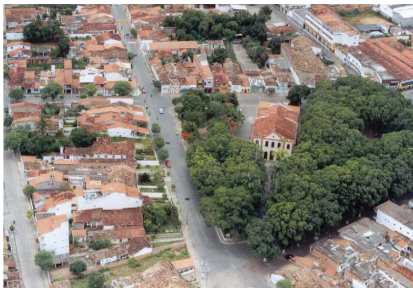
A população de Cruz das Almas, hoje, está melhor informada sobre o papel do farmacêutico

O farmacêutico considera que no esforço cotidiano é possível conquistar visibilidade, credibilidade no trabalho desenvolvido. “Na verdade o que percebo, a cada dia, é que o papel do profissional farmacêutico na comunidade e, em geral, na sociedade,